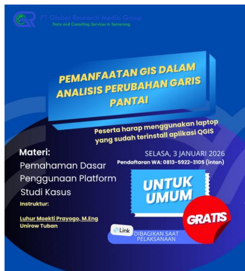
Gambar 1. Flyer Webinar

Kegiatan pengabdian ini dilaksanakan secara daring melalui Zoom pada Selasa, 3 Januari 2026, diselenggarakan oleh PT Global Research Media Group, Semarang (Gambar 1), dengan peserta sebanyak 12 orang dari kalangan umum. Metode yang digunakan adalah edukasi berbasis webinar yang dikombinasikan dengan demonstrasi dan praktik sederhana GIS.